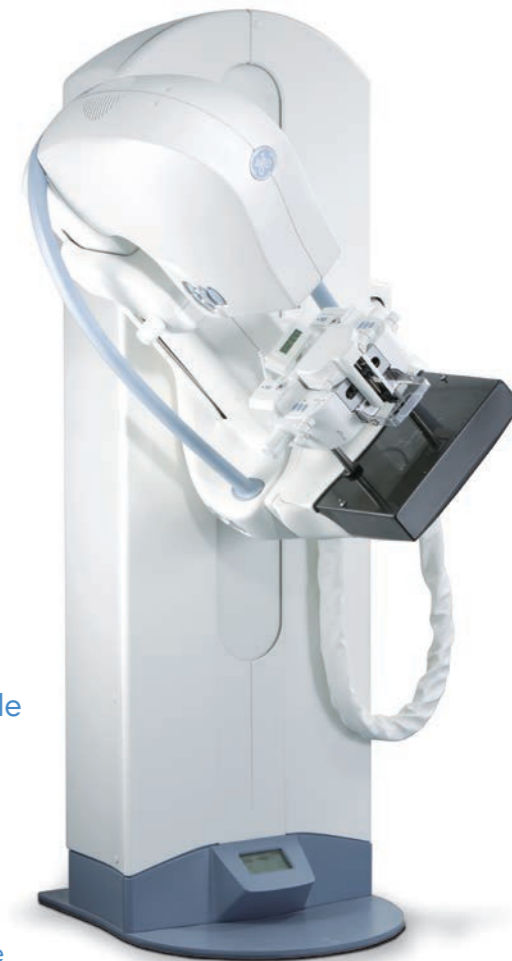
Mammografo GE Senoclaire